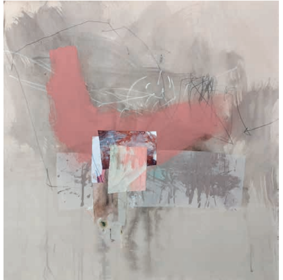
UN GLACIAR EN EL DESIERTO · técnica mixta sobre lienzo, 90 x 90 cm, 2024