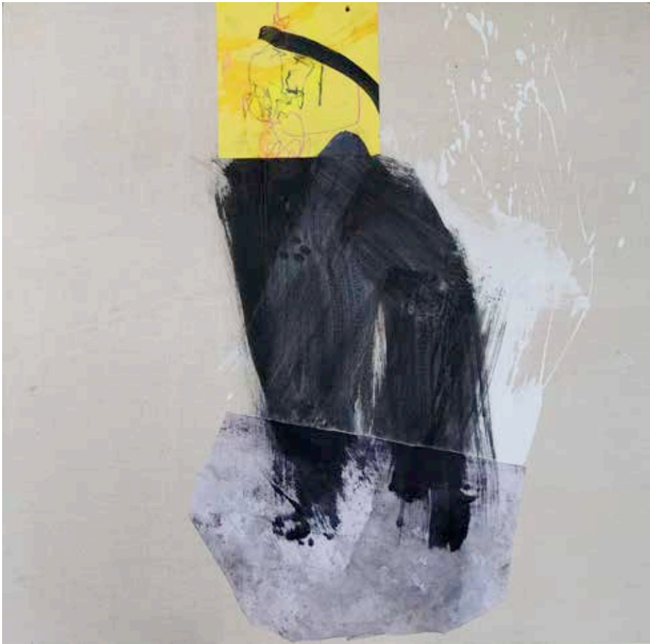
CHIEN NOIR • técnica mixta sobre lienzo, 80 x 80 cm, 2024