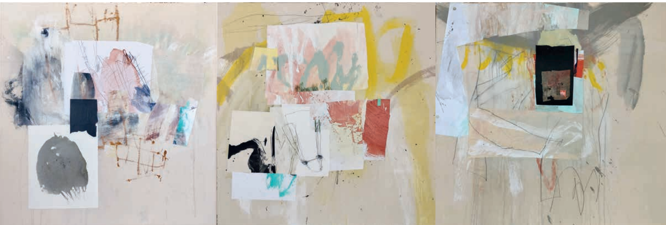
PAISAJE EMOCIONAL VOL. 6, VOL. 5 Y VOL. 4 • técnica mixta sobre lienzo, 90 x 270 cm, 2024