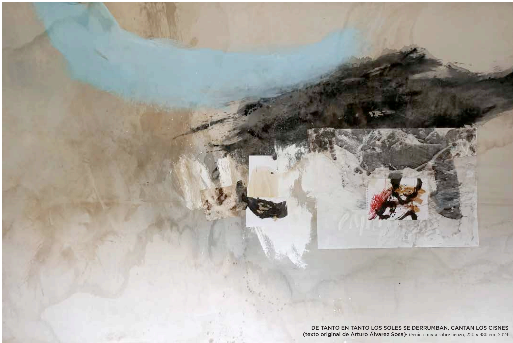
DE TANTO EN TANTO LOS SOLES SE DERRUMBAN, CANTAN LOS CISNES (texto original de Arturo Álvarez Sosa) · técnica mixta sobre lienzo, 230 x 380 cm, 2024