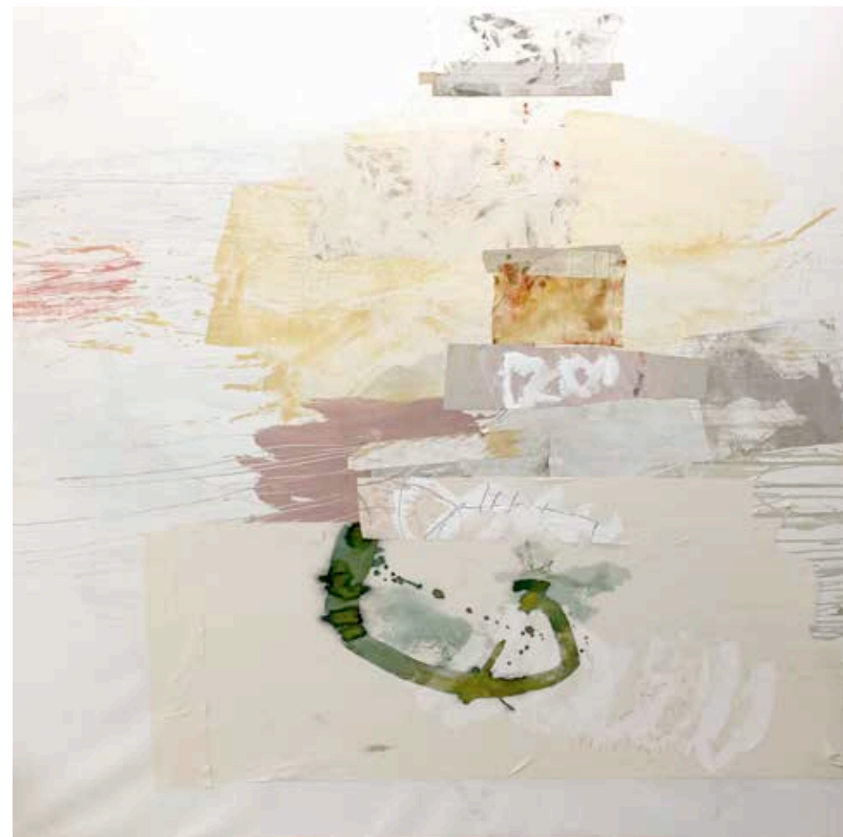
DENTRO DEL SILENCIO · técnica mixta sobre papel Fabriano, 150 x 150 cm, 2024