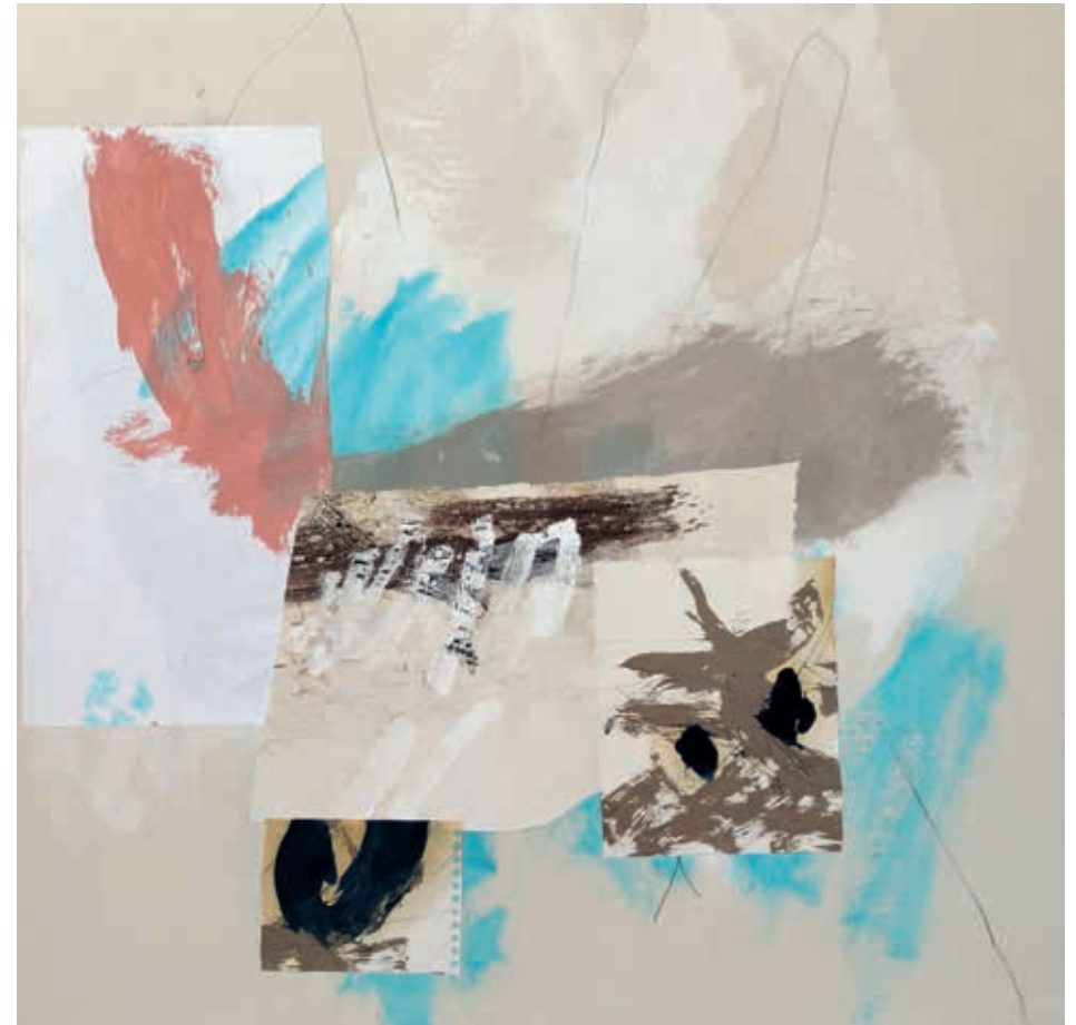
PAISAJE EMOCIONAL, VOL. 1 · técnica mixta sobre lienzo, 100 x 100 cm, 2024