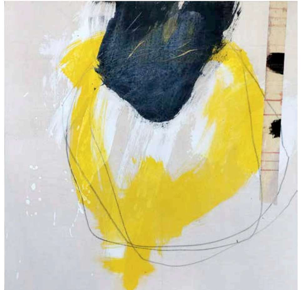
SIN TÍTULO • técnica mixta sobre lienzo, 80 x 80 cm, 2024