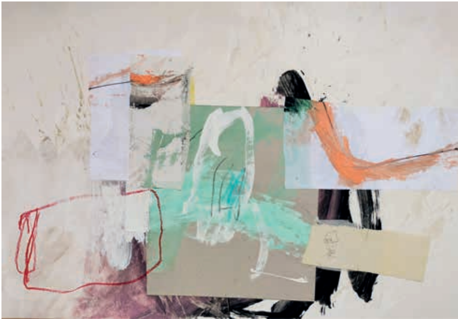
SUEÑO DE UNA NOCHE ENTRE PRIMAVERA Y VERANO técnica mixta sobre papel Canson, 57 x 82 cm, 2024