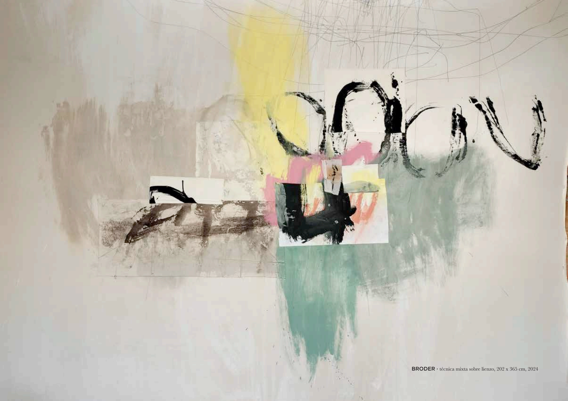
BRODER • técnica mixta sobre lienzo, 202 x 365 cm, 2024